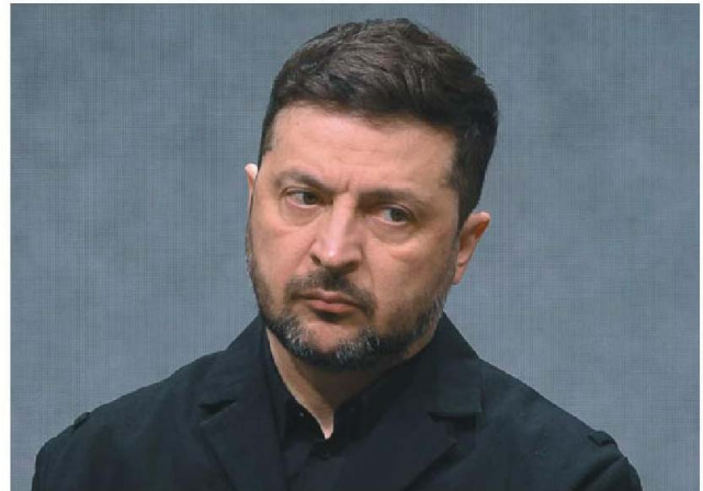
MARTIN AVDEMB/ANSA/OLIVIERO TOSCANI/GETTY IMAGES