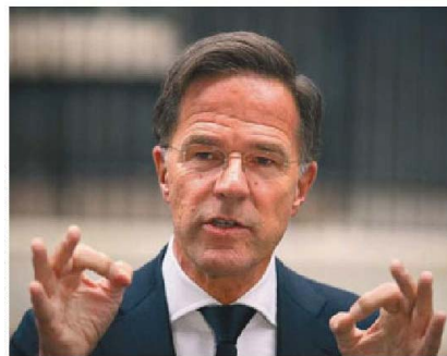
BELICISMO À esquerda, a condecoração Coração Púrpura, outorgada a todos os militares feridos ou mortos durante a conscrição, nos EUA. Nesta página, Vladimir Putin, Pete Hegseth, Donald Trump e Mark Rutte, arautos do discurso de guerra na atualidade