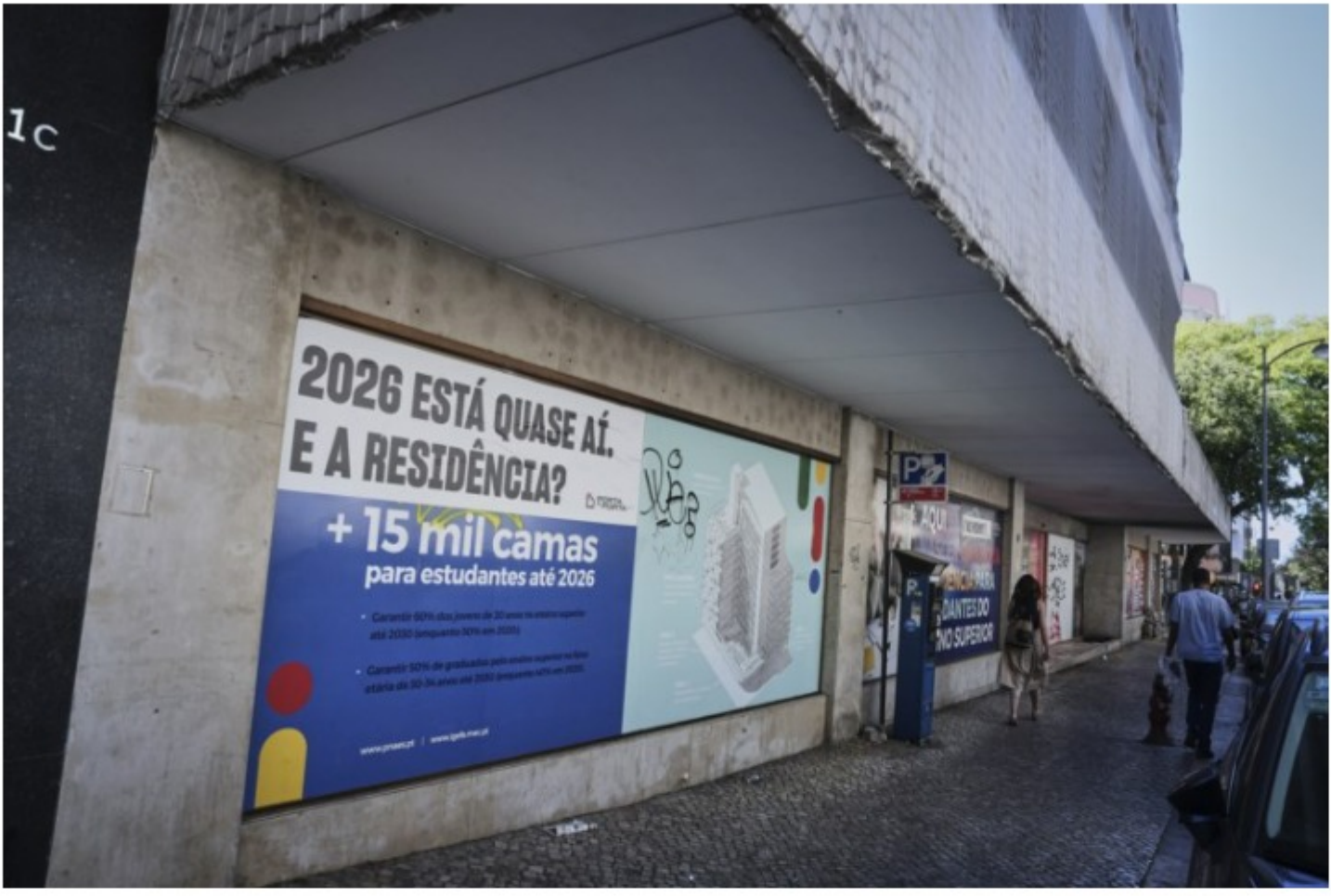
Antigo edifício do Ministério da Educação, na Avenida 5 de Outubro, está fechado há oito anos