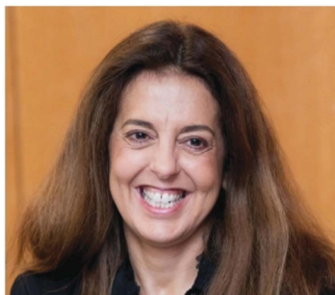
Sofia Graça Católica Porto Business School